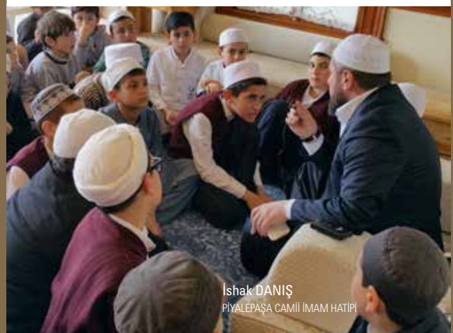
Ishak DANIŞ PIYALEPAŞA CAMİİ İMAM HATİPİ